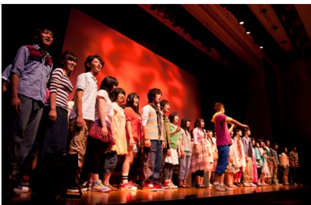
クラーク記念国際高等学校