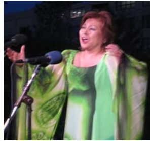
ハドソン川灯籠流し、グランドゼロから平和の祈りブルーラインが輝きます！