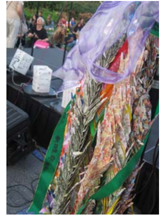
日本から千羽鶴が！