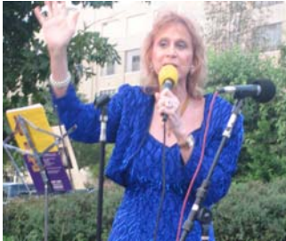
国境を越えて・・・