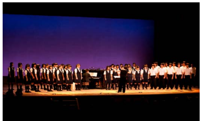
土浦第二高等学校