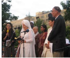
各国からのメッセージ