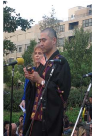
NY本願寺中垣ご住職